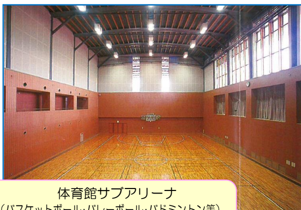
体育館サブアリーナ (バスケットボール・バレーボール・バドミントン等) 12:00 ~ 17:00