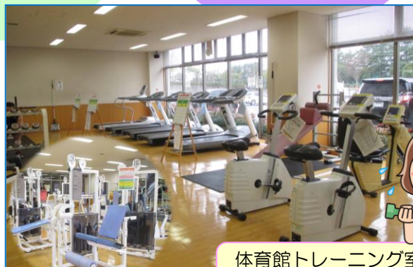
体育館トレーニング室 8:30 ~ 21:00