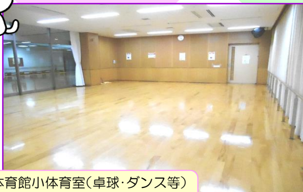
体育館小体育室(卓球・ダンス等) 8:30 ~ 17:00