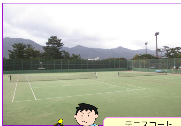
テニスコート 8:30 ~ 17:00