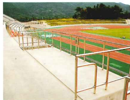
車椅子専用観覧スペース

誰もが利用しやすい施設になりました。多目的トイレや車椅子使用者専用の観覧スペースを設け、人によさしい施設になりました。