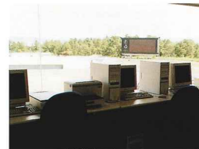
電光掲示盤操作室