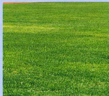
フィールド(天然芝舗装)

陸上競技場のグレードアップに伴い、第3種公認陸上競技場を新設しました。1周400mの全天候舗装トラックを整備しました。インフィールド、アウトフィールドは天然芝舗装です。