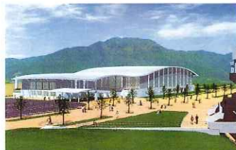
県立浜山体育館 (平成15年8月完成予定) ●延べ床面積: 9,935m 2 ●観客収容数: 3,500人