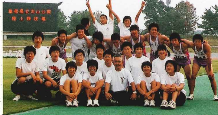
平成14年全国高校総体で、男子総合優勝を果たした 大社高校陸上部のみなさん