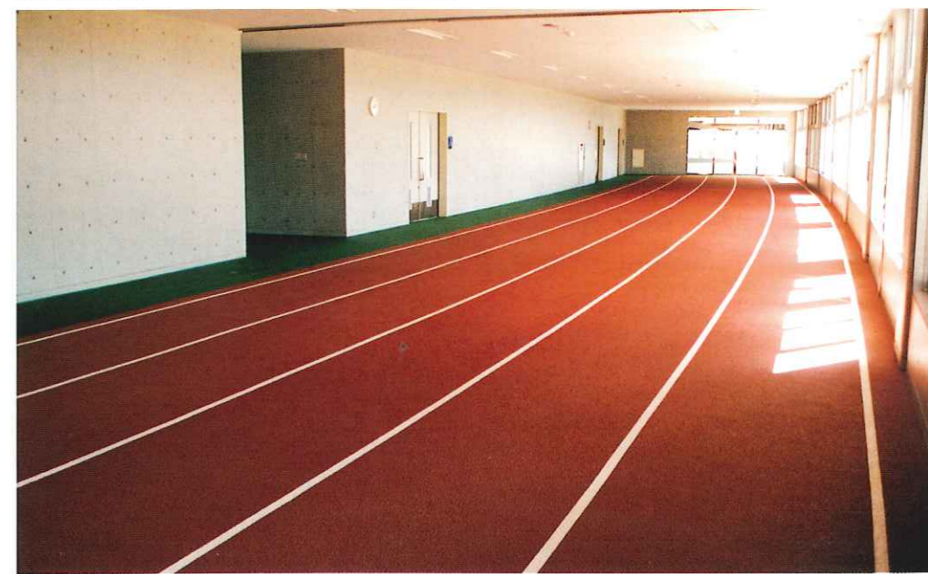
ウォームアップスペース(雨天走行場)